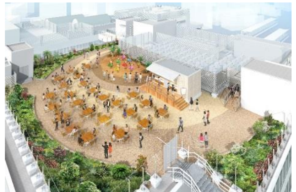
屋上広場イメージ