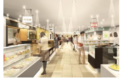
1階食料品フロアイメージ

2階は、グロサリー・ドラッグストアなどを集積し、22時まで営業します。駅直結の利便性に加え、営業時間の拡大で上質な日々の生活をサポートします。