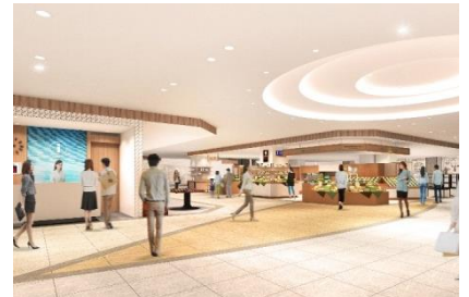
3階ショップエリアイメージ

様々なイベントやワークショップを展開する地域のコミュニティスペースです。湘南・茅ヶ崎の魅力を発信、お客さまに「いつも楽しい変化」をご提供し、茅ヶ崎ならではのイベントを体験していただけます。