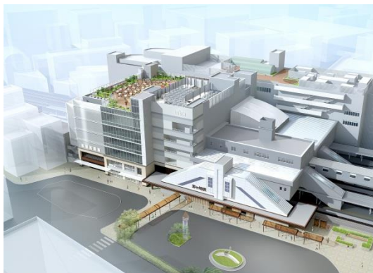
外観イメージ（南口側）

また、湘南地区初進出が27店舗あり、ラスカ茅ヶ崎でのショッピングや飲食を通して、より豊かな茅ヶ崎ライフを楽しんでいただけます。