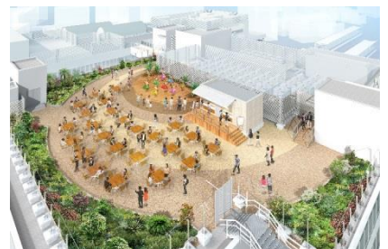
屋上広場イメージ

南に江の島やえぼし岩、西に富士山が望むことができる屋上広場を設け、シーサイドの風を感じながらゆったりと過ごしていただけるスペースです。